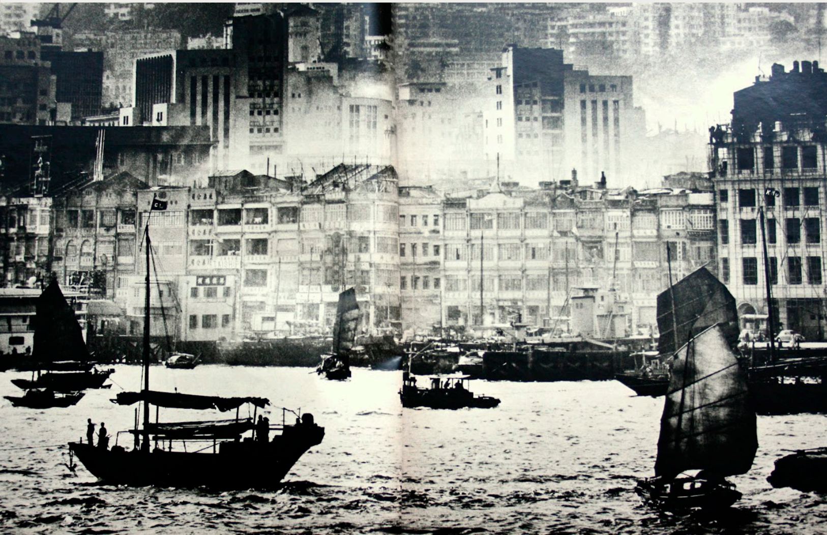
Hong Kong, 1960.